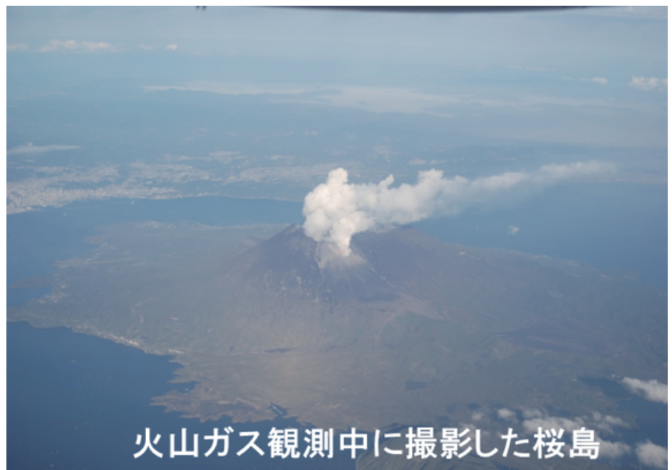
火山ガス観測中に撮影した桜島

西之島付近で海底火山の噴火が発生したため、講演内容は主にこの活動に関するものに変更されます。