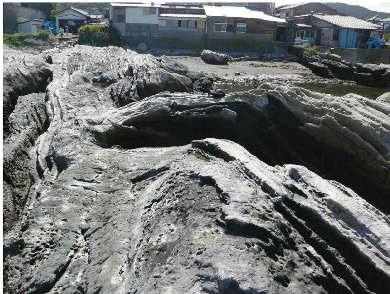
千倉層群に見られるスラストアンチクライン